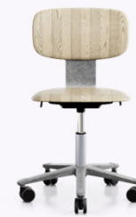
HÅG Tion 2200 Sitz und Rückenlehne aus Holz