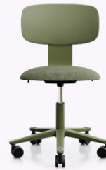
HÅG Tion 2140 Sitz gepolstert