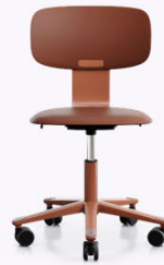
HÅG Tion 2100 Ohne Polster