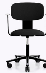
HÅG Tion 2160 Sitz und Rückenlehne gepolstert